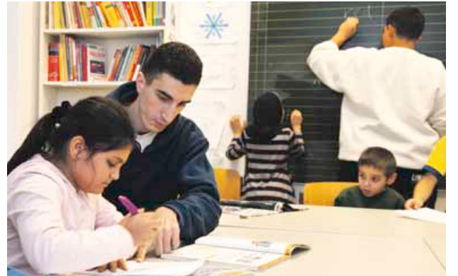
Im Blueberry kann man den Computerführerschein machen, die Stadtbibliothek ist eine Fundgrube für jede Altersklasse, verschiedene Lernhilfen gibt es im Mehrgenerationenhaus

Das Quartier bietet mehr kostenlose oder zumindest preiswerte Angebote als die Meisten ahnen: Betreuung in der Bildungsetage, Musizieren in der Paul-Hindemith-Musikschule, Hausaufgabenhilfe im Blueberry