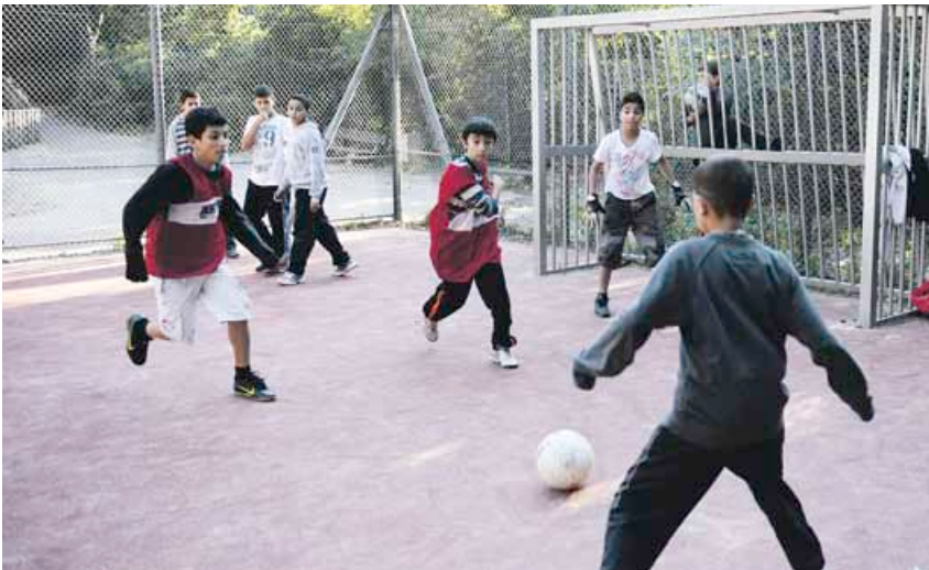
Das kommt an: Fußball auf dem Boddinplatz

Die Anwohner hatten sich schon bei der Umbauplanung für den Boddinplatz zu Wort gemeldet. In Kürze werden die Bauarbeiten beginnen. Ursprünglich sollte der Platz schon im Sommer nach Wünschen der Anwohner umgestaltet werden. Das Bezirksamt entschied sich aber, den Baubeginn zu verschieben, damit der Platz nicht gerade in den schönsten Monaten abgesperrt werden muss. Der 50 000 Euro teure Umbau wird aus dem Quartiersfonds 3 bezahlt.