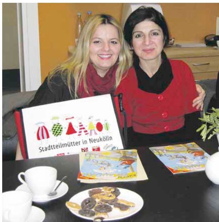
Projekte wie die Neuköllner „Stadtteilmütter“ werden mit Geldern der Städtebauförderung finanziert – die Bundesregierung will sie um die Hälfte streichen

Die Kürzungspläne der Bundesregierung müssen noch vom Bundestag beschlossen werden. Daher appelliert der Arbeitskreis der Berliner Quartiersmanagementbeauftragten an alle Bundestagsabgeordneten, sich für eine Rücknahme der Kürzung einzusetzen. „Der integrative Ansatz des Programms Soziale Stadt hat in den letzten zehn Jahren erheblich dazu beigetragen, die Abwärtsspirale abgehängter Quartiere zu stoppen und positive Entwicklungen anzustoßen“, heißt es in dem Aufruf.