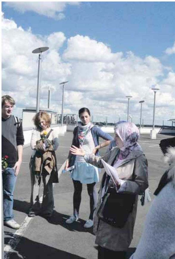
Eine ungewöhnliche Idee: Sightseeing dort, wo man wohnt und lebt

Infos und Buchung unter Telefon 70 222 023 oder unter www.zweite-heimat-neukoelln.de