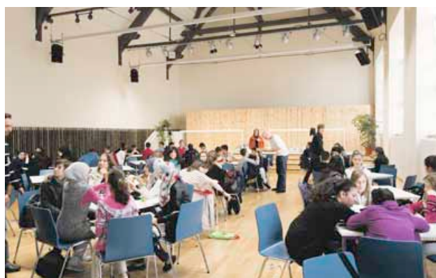
Gelungene Verwandlung: Die alte Sporthalle der Albert-Schweitzer-Schule ist jetzt eine Mensa

Die alte Turnhalle der Albert-Schweitzer-Schule ist zur Schulmensa umgebaut worden. Seit Beginn des neuen Schuljahres steht der Raum den 700 Schülern als Speisesaal und Cafeteria zur Verfügung.