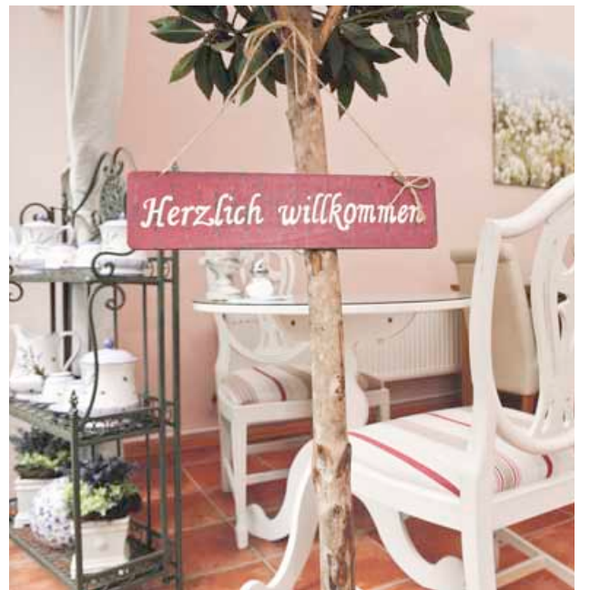
Der besonders bei den Älteren beliebte Kieztreff in der Reuterstraße 13 ist wieder geöffnet

Das im Juni 2008 eröffnete Café hat sich schnell zu einem beliebten Anlaufpunkt für ältere Menschen aus dem Flughafenkiez entwickelt. Hier können sie sich nicht nur treffen, sondern auch vielfältige Hilfe finden. Die zehn Mitarbeiterinnen sind vom Beschäftigungsträger Bequit als Alltagsassistentinnen geschult worden, sie machen Hausbesuche, erledigen Besorgungen oder gehen mit den alten Leuten in der Hasenheide spazieren. Außerdem werden Spiel- und Bastelnachmittage veranstaltet, Filme gezeigt und Feste gefeiert. Im Juni 2009 musste das Kiezcafé schließen, weil die ABM-Stellen ausliefen. Die alten Leute hatten keinen Treffpunkt mehr, die Beschäftigten wurden wieder arbeitslos und auch im Quartier