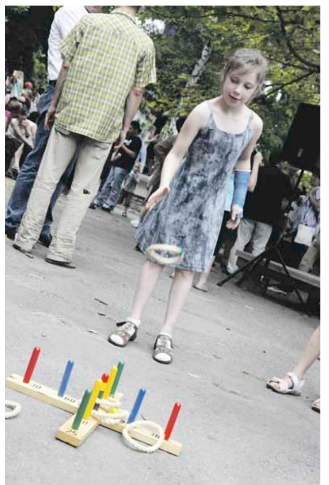
Die kleinen und großen Bürger hatten ihren Spaß und Bürgermeister Buschkowsky pflanzte einen Apfelbaum

Studierende der Katholischen Hochschule für Sozialwesen haben eine kleine Erhebung zu Gesundheit, Ernährung und Lebensstil von Nutzern des interkulturellen Pyramidengartens zusammengestellt: Die Broschüre kann heruntergeladen werden unter http://qm-flughafenstrasse.de/fileadmin/flughafenstr/dateien/QF1_Unterlage/garten.pdf . Im Quartiersbüro sind auch noch einige gedruckte Exemplare erhältlich.