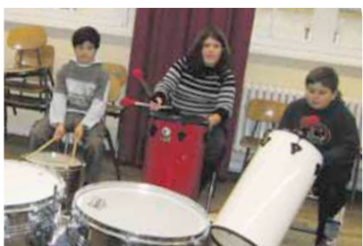
Ob die Trommelsignale der „Boddin-Beatz“ bei der Bundesfamilienministerin ankommen?

Genau an dem Punkt muss sich aber in Zukunft auch etwas ändern: Kinder aus benachteiligten Familien brauchen eine regelfinanzierte Förderung, sie brauchen ein „ganzheitliches“ Konzept mit Hausaufgabenbetreuung, Theaterworkshops, Musik-AGs und einem warmen Mittagessen in der Schule. Wer braucht dann noch Bildungsgutscheine?