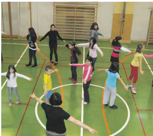
Schule ist heute mehr als staubtrockene Wissensvermittlung: Tanzprojekt an der Hermann-Boddin-Schule

Der Begriff, so weiß Wikipedia, kommt vom althochdeutschen „bildunga“ (Schöpfung, Bildnis, Gestalt) und bezeichnet die Formung des Menschen im Hinblick auf sein „Menschsein“. Ein Merkmal der Bildung, das fast alle Bildungstheorien gemeinsam haben, ist das reflektierte Verhältnis zu sich, zu anderen und zur Welt. „Bildung beginnt mit Neugierde“, sagte einmal der Schweizer Philosophieprofessor Peter Bieri. Man lernt sich selbst kennen und die Welt. Der Gebildete ist also einer, der sich in der Welt zu orientieren weiß, der hinterfragt und kritisch beurteilt, statt nur nachzuplappern, was andere sagen.