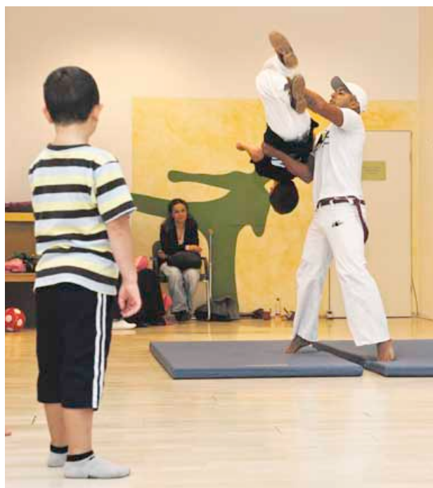
Im Mehrgenerationenhaus kann jetzt ein Raum für Sport genutzt werden – der Aktionsfonds gab das Geld dazu

Wer noch eine gute Idee hat, die dem Flughafenkiez zugute kommt, sollte sich beeilen. Jedes Projekt kann mit bis zu 1000 Euro gefördert werden. Die Abgabefristen für die nächsten Juysitzungen enden am 25. Oktober und am 22. November.