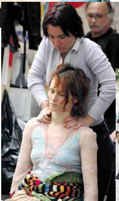
Bunt und gut gelaunt präsentierte sich der Flughafenkiez auf dem Erlanger Straßenfest